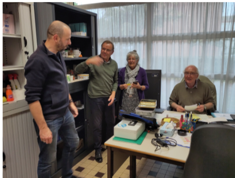
Figure 11: Quelques bénévoles de la COOP

Ce document, ainsi que les illustrations, sauf mention contraire : © 2024 Georges Khaznadar, CC-BY-SA-4.0