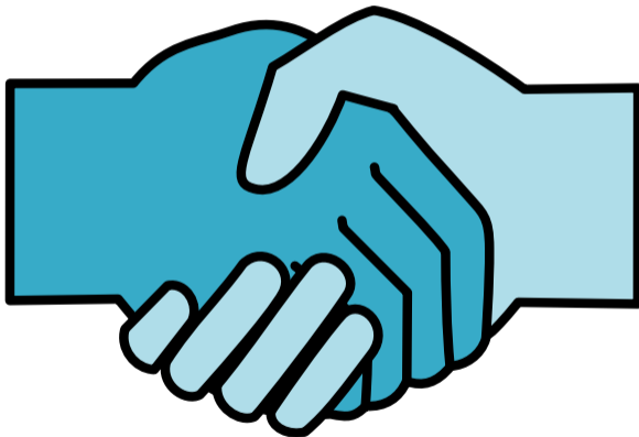
Figure 8: logo de SLM

Django est un module Python... mais SLM utilise plus que Django