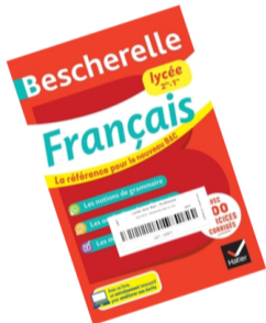
Figure 2: Un livre à prêter, et son code-barre

Il s'agit de gérer les livres scolaires prêtés aux étudiants du second cycle (environ 20 000 livres en stock, pour 1 500 étudiants).