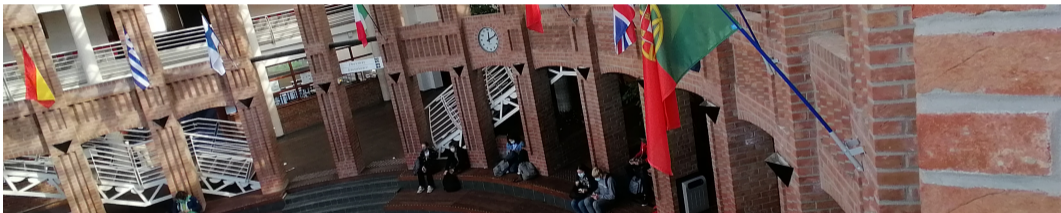
Figure 1: Le hall du lycée

SLM a été développé au lycée Jean Bart de Dunkerque , à partir de 2022, dans le cadre d'une numérisation des actions de la coopérative scolaire.